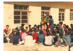
체육대회(1979) Sports Festival