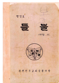
들불문집 The First Issue of Deulbul Literature