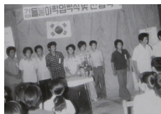
제3기 입학식 및 진입식(1979) Entrance Ceremony