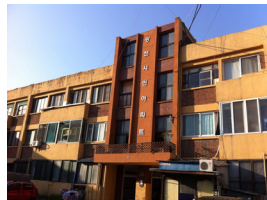
광천시민아파트 Citizen's Apartment in Gwangcheon-dong