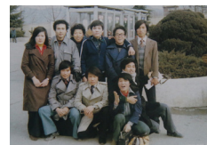
제1기 졸업여행(1980) graduation trip